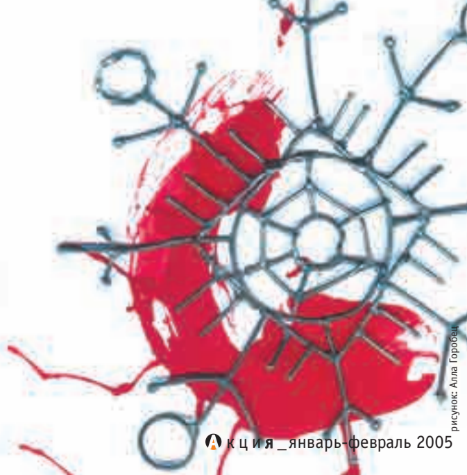
рисунок: Алла Горбач