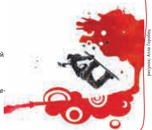
рисунок: Алла Горобец

ОЛЬГА ПАВЛОВА Крылатские холмы, 5–27 февраля, каждый выходной. Вход свободный.