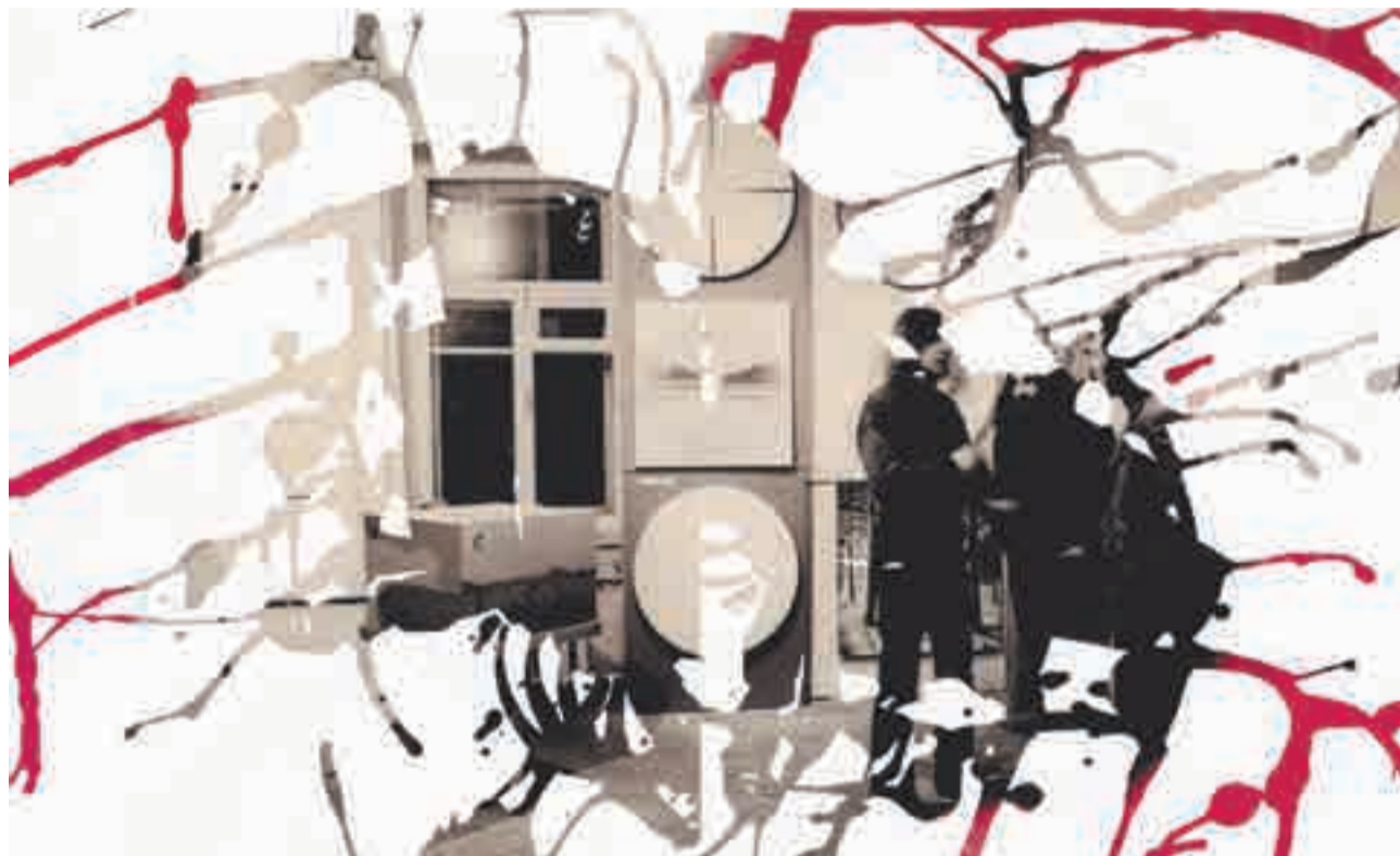
рисунок: Алла Горбач

И.К.: Это как скульптура, но только имитационная. Из странных пластин, которые изображают разные виды мрамора или какие-то драгоценные поверхности и так далее.