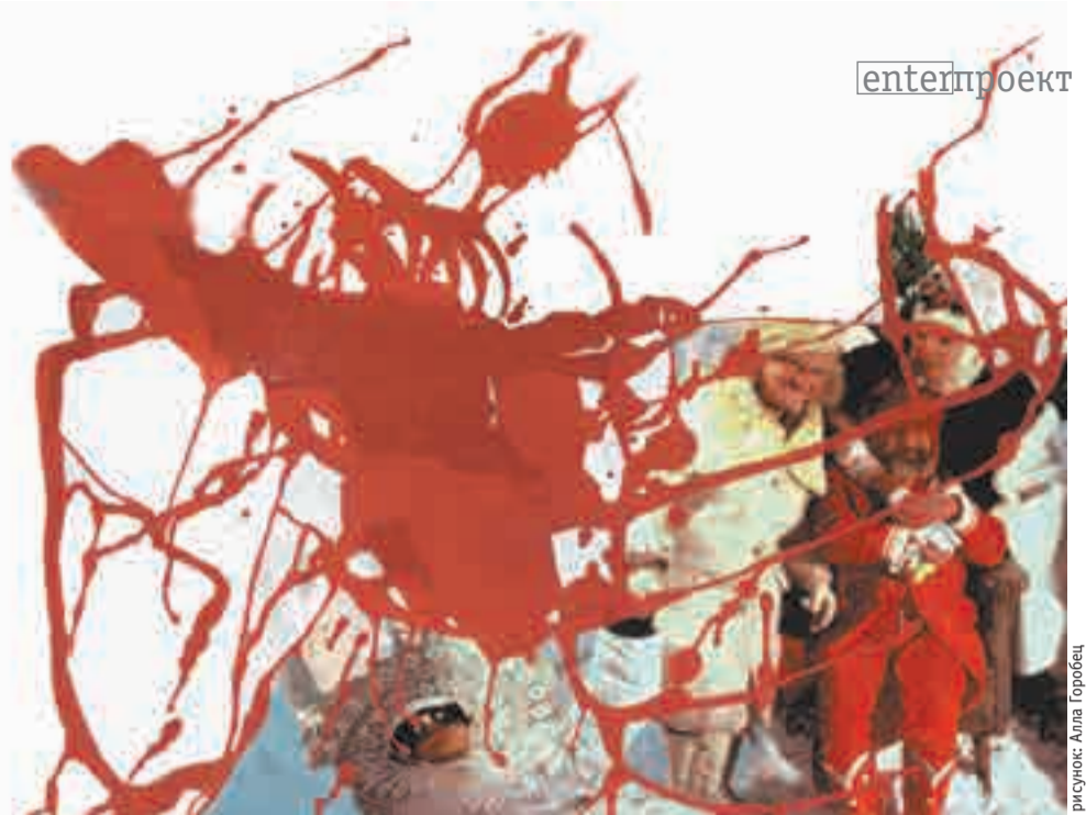
рисунок: Алла Горобец

Параллельные проекты проходят по всей Москве, подробную программу параллельных проектов ищите на www.moscowbiennale.ru